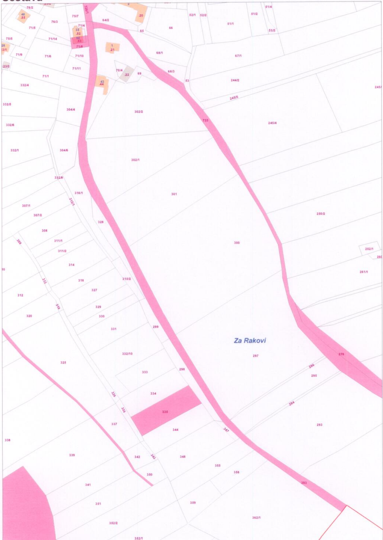
Mapa v měřítku 1:2500